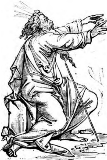
D'après un dessin de Golthius.

Moïse tenait ses mains étendues, Et Israël était victorieux.