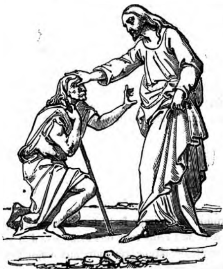
Jésus guérissant l'aveugle de Jéricho.

DON DIVIN PUNI DU DERNIER SUPPLICE CHEZ LES JUIFS.