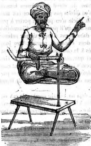
(1) Je reproduis ici une petite gravure représentant un fakir indien,

On fait venir un de ces hommes de la classe des parias ou des chameliers habitués à ce métier, qui, pour une somme minime, sont prêts à se laisser enfouir pour un temps voulu, pourvu qu'on leur donne deux jours pour se préparer, et que l'on s'engage à laisser faire à leurs camarades les préparatifs de l'enterrement et de la résurrection, qui consistent à les coudre très-exactement dans un linceul (le plus imperméable est le meilleur), et qu'on les place dans un double cercueil, le dernier en plomb, bien soudé, si la durée de la catalepsie doit être longue. On croit qu'ils jeûnent et se purgent, car ils arrivent pâles et affaiblis, se font boucher toutes les ouvertures du corps avec de la cire molle, toujours dans le but de se préserver des miriapodes et autres insectes, et se livrent aux hommes habitués à ces pratiques. Le cercueil, correctement clos, est descendu dans la tombe et recouvert de terre, sur laquelle on sème ordinairement de l'avoine, et près duquel les parieurs incroyables placent des sentinelles pour plus de sûreté (1).