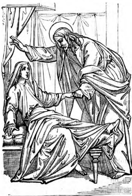
(Bible de Julio Schnorr. — Leipzig.)

J'ai voulu montrer par ces images combien notre nature cachait de richesses inconnues ; j'ai voulu montrer ce magnifique pouvoir de l'homme exalté par la foi produisant des œuvres où Dieu semble intervenir : vaste sujet de méditation duquel notre temps nous éloigne. Peut-être le magnétisme est-il destiné à faire revivre les grandeurs déchues, à faire apparaître aux yeux des générations nouvelles ces génies puissants qui étonnèrent l'antiquité !